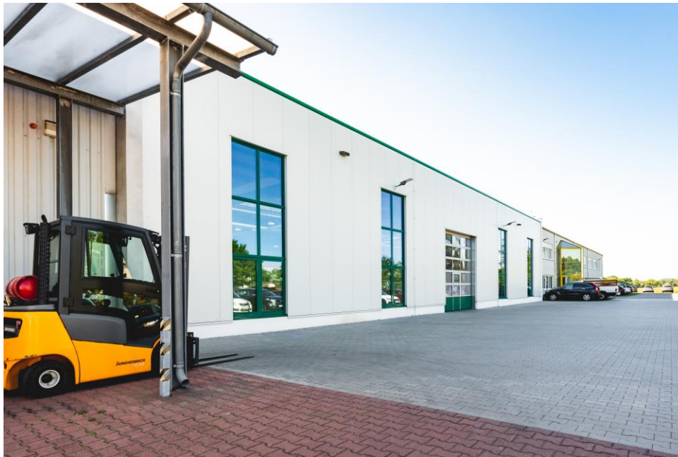
Hauptsitz in Werneuchen mit Produktion, Lager und Verwaltung