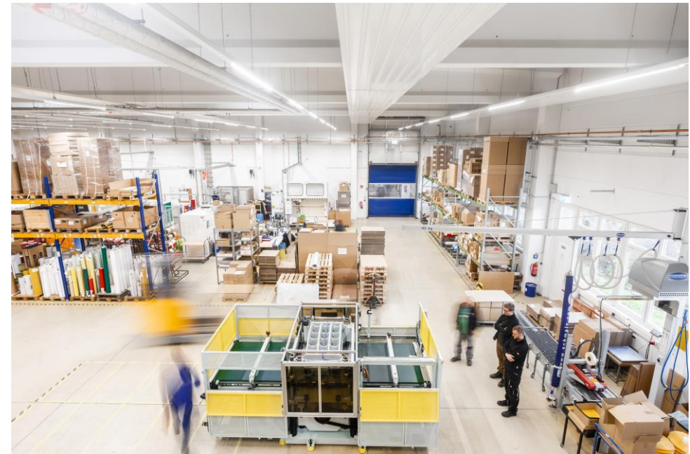
Blick in eine Produktionshalle am Hauptsitz