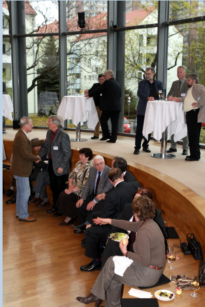
Impressionen vom Empfang